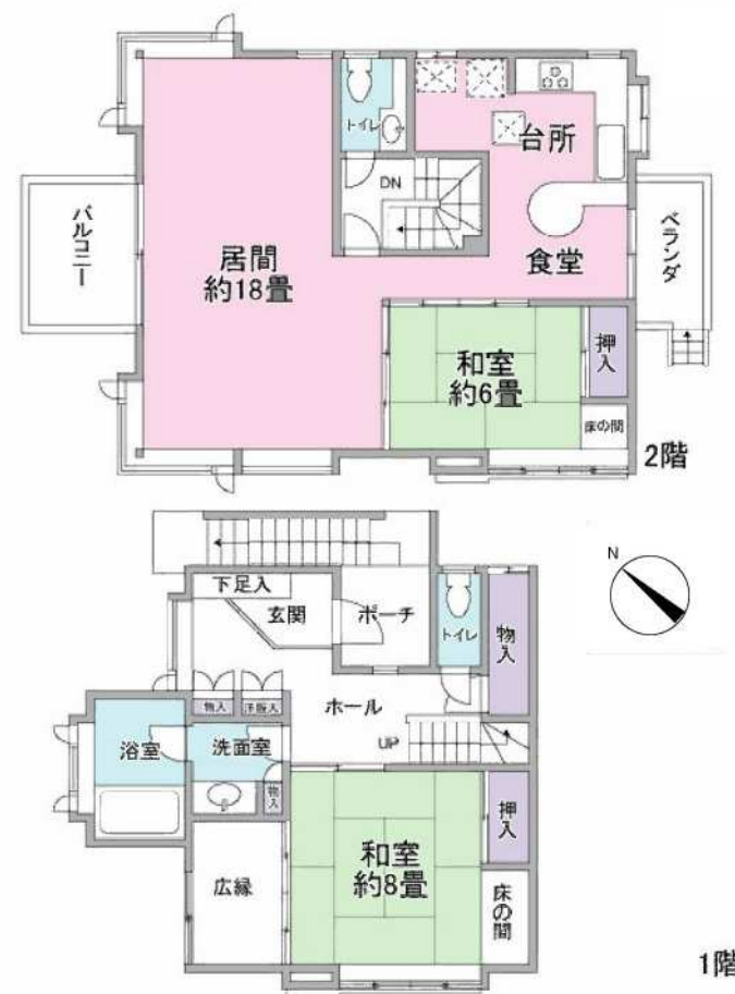
※図面と現況が異なる場合は現況を優先します。